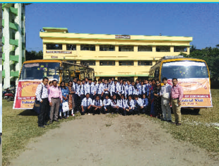
Industrial Visit by the Faculty of Commerce carried out on 12/12/17 at M/S Super Treads Pvt.Ltd , Siliguri.