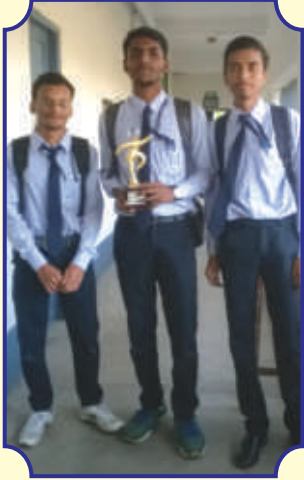
"Tobacco Control Awareness" এর উপর কুইজ প্রতিযোগিতায় বিজয়ীরা