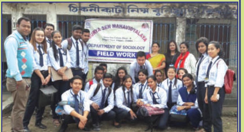
Field Work undertaken by the Department of Sociology