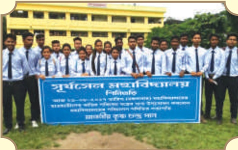
সূর্যসেন কলেজে ছাত্র ছাত্রীদের পরিষেয় বস্ত্রের শুভ উদ্বোধন হল ২৯ এ আগস্ট, ২০১৭ তে