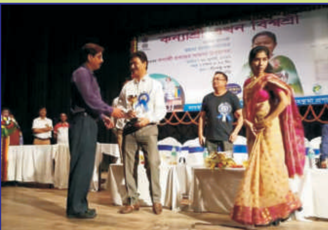
The Best Performing College in Kanyasree Prakalpa 2017