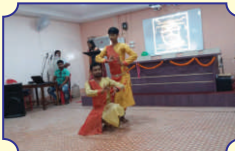
আন্তঃ বিভাগীয় নৃত্য প্রতিযোগিতা