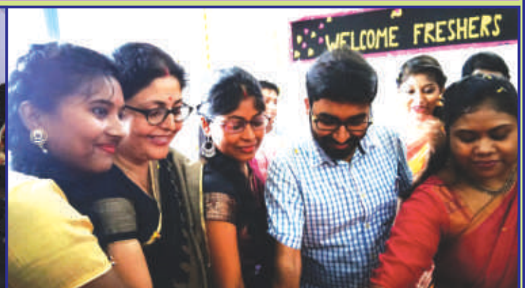
Freshers' welcome by Various Departments [Sociology, Geography]