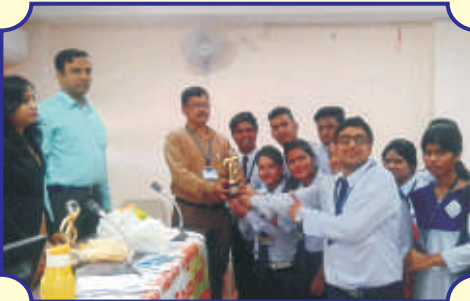
"Tobacco Control Awareness" এর উপর কুইজ প্রতিযোগিতায় রানার্স