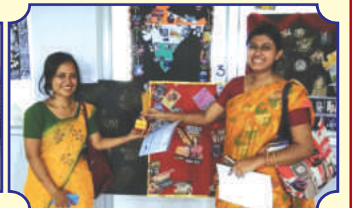
আন্তঃ কলেজ কোলাজ প্রতিযোগিতা বিজয়ীরা