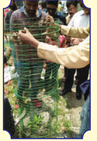
বিশ্ব পরিবেশ দিবস উপলক্ষে কলেজ ক্যাম্পাস এ বৃক্ষ রোপণ