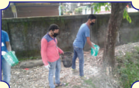
সাতই আগস্ট, ২০১৭ তে স্বচ্ছ ভারত অভিযান চলছে সূর্যসেন মহাবিদ্যালয়ে