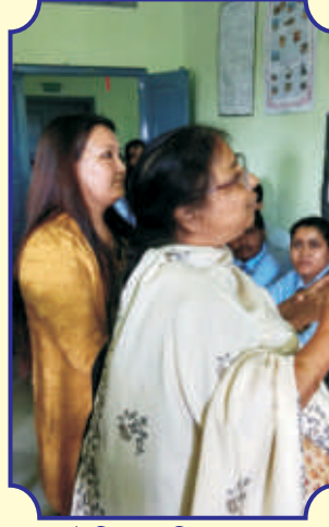
ইতিহাস বিভাগের “পোস্টার প্রেজেন্টেশন”