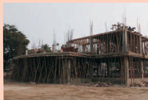
Construction of a new block funded by Amit Agarwal Foundation is in full swing