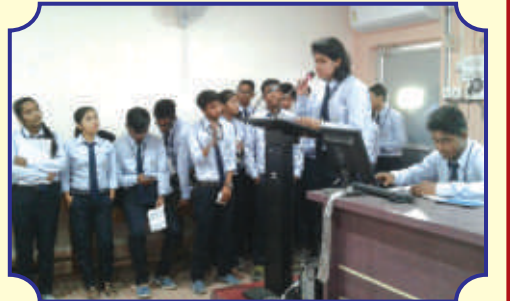
ভূগোল বিভাগের ছাত্র-ছাত্রীদের আলোচনা সভা