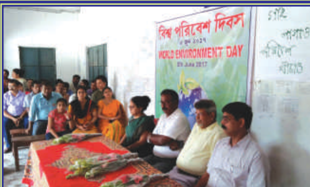
Observation of World Environmental Day by the NSS Units of SSM