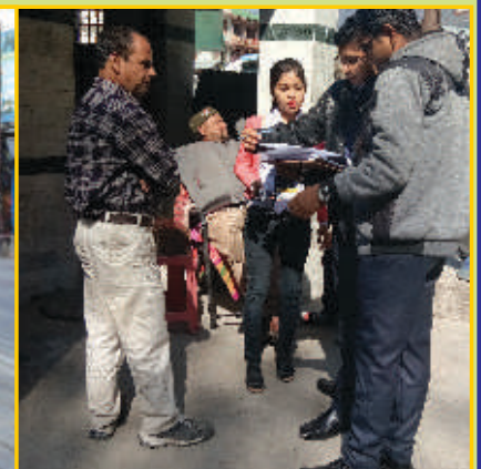
Excursion to Manali organized by the Department of Geography