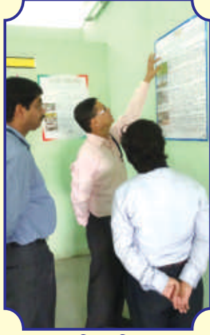
সমাজবিদ্যা বিভাগের “পোস্টার প্রেজেন্টেশন”